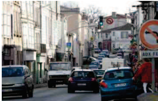
Le contournement de Marans demeure une priorité.

Se poserait ensuite la question de créer une voie entre Sainte-Soulle et Aigrefeuille-d'Aunis (l'ex-camp militaire américain de Croix-Chapeau), avant d'améliorer ensuite le trajet ralliant Rochefort, aménagé sur l'emprise d'une ancienne voie ferrée. Un nouveau tracé qui allégerait le